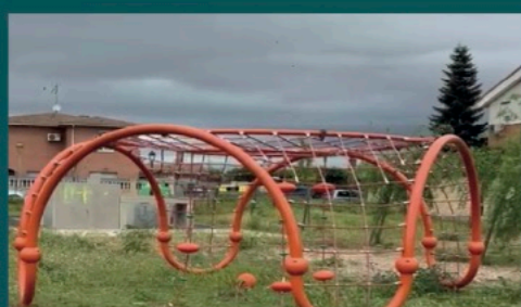
Comienzo de la instalación de equipamientos nuevos en la c/ Juan Ramón Jiménez para una nueva zona de ocio deportivo.

Para evitar retrasos una vez que la Junta de el paso el ayuntamiento va a acordar ya la cesión del terreno y agilizarlo al máximo.