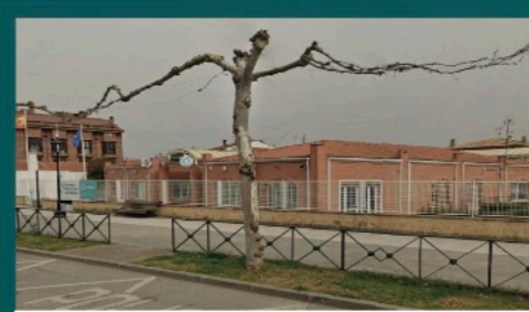
Inicio de los trámites para la ampliación de la comisaría de Policía Local , ante la llegada de nuevos agentes.