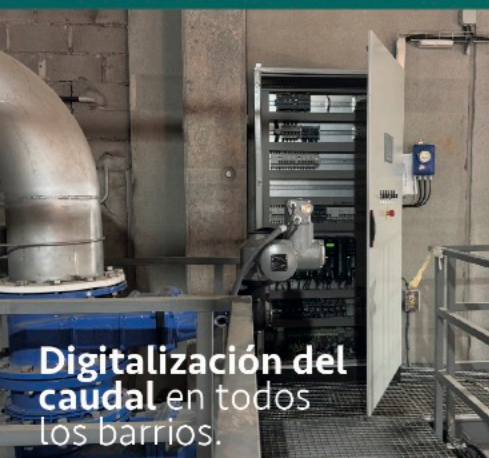
Digitalización del caudal en todos los barrios.