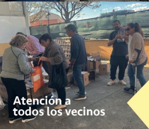
Atención a todos los vecinos

Cerca de 44 municipios sufrieron problemas de suministro y nuestro municipio días antes también tuvo problemas de presión.