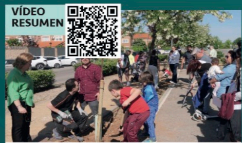
Plantación masiva de árboles con la iniciativa 1árbol-1niñ@ para todos los nacidos en 2025 en los barrios de Parque Vallejo y Las Suertes.